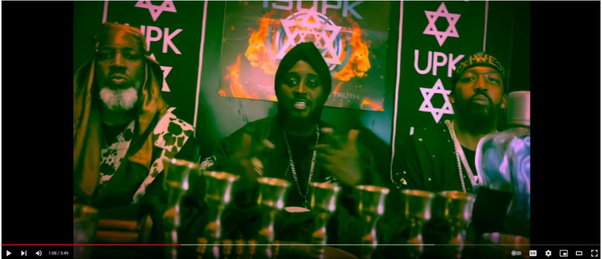
Una captura de pantalla de YouTube del video musical de Natazab para "Death Con 4" presentando a dos miembros de ISUPK- Escuela Israelita de Conocimiento Práctico Universal

Otro tropo antisemita promovido por los seguidores extremistas del BHI insiste en que a los judíos se les otorga un cierto nivel de protección debido al supuesto control que tienen sobre la sociedad. Un video de una sucursal australiana de Great Millstone, otro grupo extremista de BHI, insiste en que “esas personas de sombrero pequeño están siendo protegidas en todo el mundo ... son las que están en el poder en este momento”.(10)