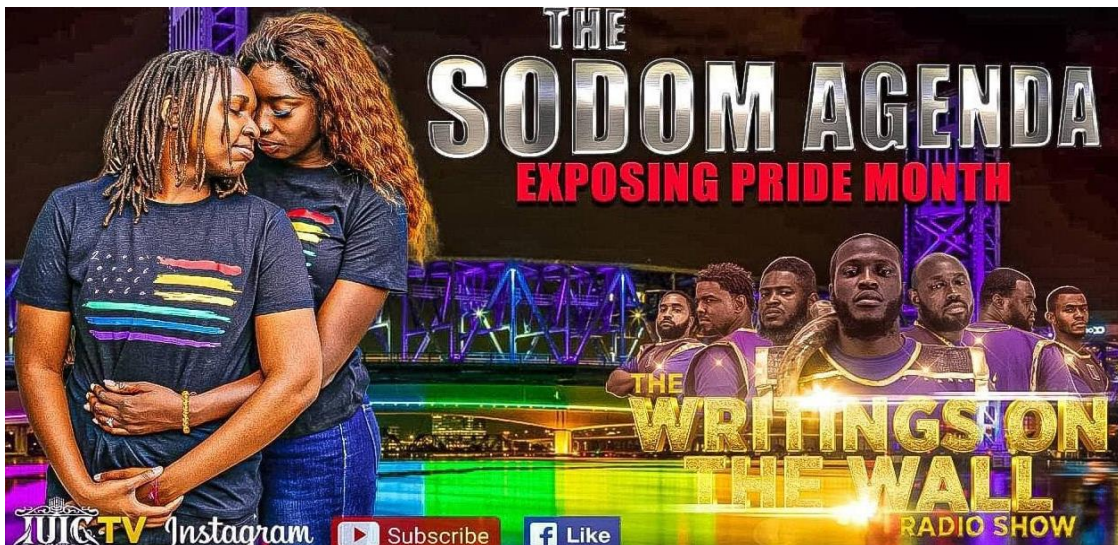
Esta imagen de YouTube se usó para anunciar un episodio del programa de radio de IUIC Tallahassee, dirigido a la comunidad LGBTQ+.(14)

Los adherentes extremistas del BHI creen que los miembros de la comunidad LGBTQ+ son malvados. Un miembro de ISUPK Killeen (Texas), compara un evento drag para niños con el asesinato de niños en una escuela primaria en Uvalde, Texas, en mayo de 2022, afirmando que "es el espíritu el que quiere cazar y asesinar niños". Insiste en que el opresor está tratando de arrastrar a los niños a esta cultura "malvada" que ellos consideran una "abominación".(11) Otro video de ISUPK Staten Island se refiere a la comunidad LGBTQ+ como una "plaga" destinada a "destruir a los elegidos del Señor".(13)