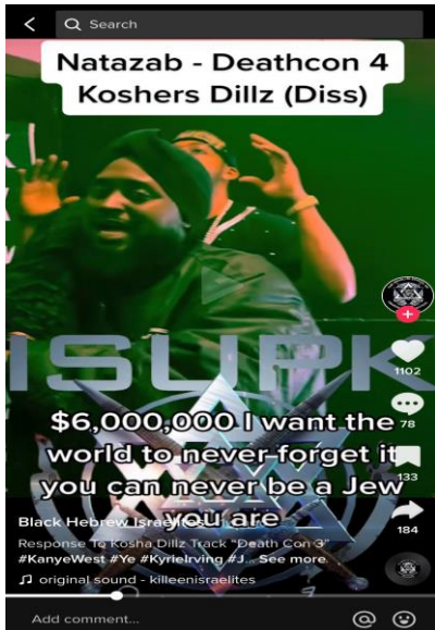
Una captura de pantalla de una cuenta de ISUPK TikTok que muestra parte del video musical de Natazab "Death Con 4", incluyendo parte de la letra que refiere a los 6 millones de judíos asesinados en el Holocausto como "$ dólares 6,000,000".