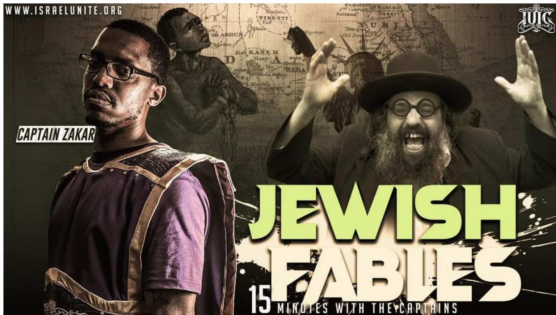
La imagen en miniatura del video "Fábulas Judías" de IUIC en YouTube.

A menudo, los grupos extremistas del BHI hacen referencia a la Revelación 2: 9 y 3: 9 del Nuevo Testamento, pasajes éstos sacados de contexto para "probar" que la Biblia indica que un grupo de impostores se hará pasar por judíos en el futuro: "Conozco la calumnia de parte de los que dicen ser judíos y no lo son, sino que son una sinagoga de Satanás."(5) El uso de este pasaje para referirse a todos los judíos como una sinagoga de Satanás, fue la piedra angular del antisemitismo teológico cristiano medieval y refleja las creencias del movimiento supremacista blanco Identidad Cristiana. Los partidarios de Identidad Cristiana alegan que los Arios blancos son los verdaderos Israelitas y, al igual que los creyentes extremistas del BHI, sostienen que los judíos de hoy son impostores y son los "Hijos de Satanás". Asimismo, el líder de la Nación del Islam, Louis Farrakhan, también acusó a los judíos de "no ser judíos reales... estr engañando y enviando a esta nación [EE.UU.] al infierno."(6) Este tropo antisemita se encuentra presente en los tres Movimientos pese a que sus ideologías entran en conflicto.