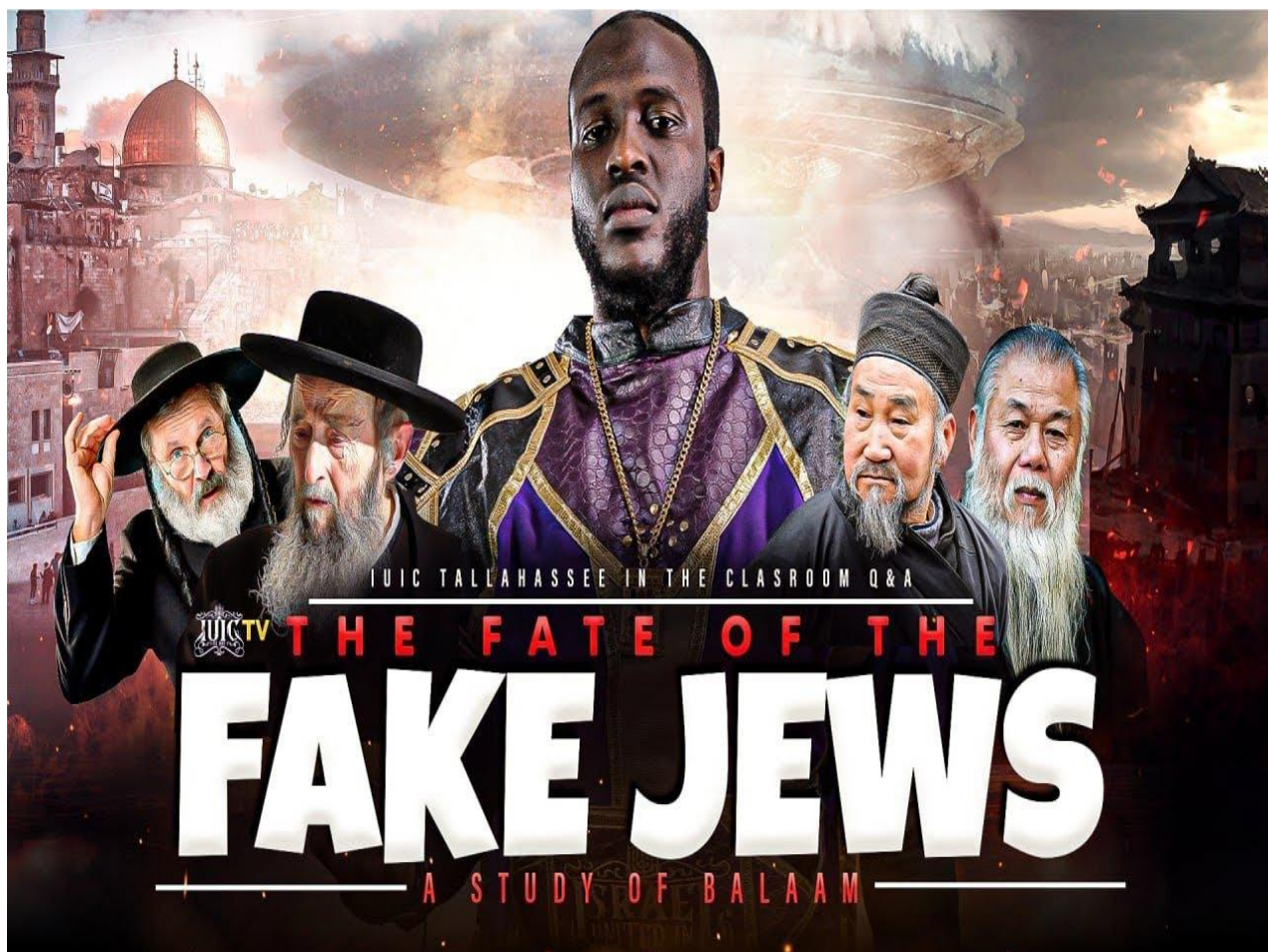
Una imagen promocional para una próxima transmisión en vivo de IUIC en YouTube titulada "El fin de los falsos judíos"..(21)

La Escuela Israelita del Conocimiento Práctico Universal (ISUPK) tiene su sede en Pensilvania y fue creada en 2006. Parece ser una organización sin fines de lucro registrada en varios estados, incluidos Nueva York, California y Michigan.(22) Tienen varios canales de TikTok con 10.000 seguidores.